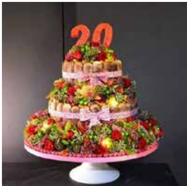
Le gâteau de roses de Florence