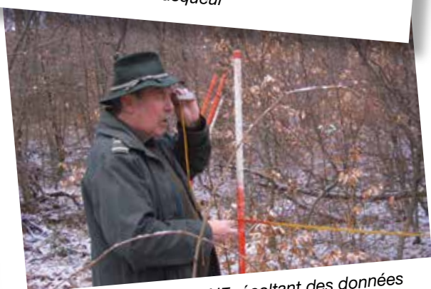
Agent technique du DNF récoltant des données dendrométriques