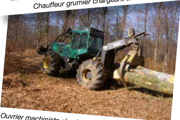
Ouvrier machiniste récoltant des grumes à l'aide d'un débusqueur