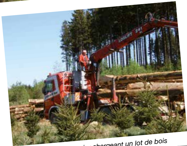
Chauffeur grumier chargeant un lot de bois