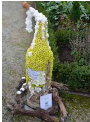
Bouteille de champagne de Julien