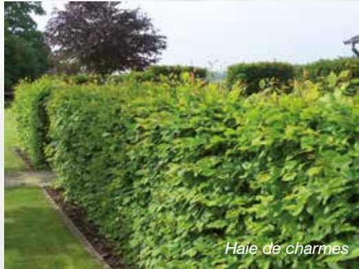
Haie de charmes

Le charme se rencontre principalement dans les forêts de Moyenne Belgique et de Basse-Ardenne ; il fait partie du sous-étage des forêts de feuillus et des taillis. Son bois est blanc, dense mais peu durable, peu élastique. C'est un excellent bois de chauffage, au pouvoir calorifique très élevé. En raison de sa dureté, on l'utilise pour fabriquer une grande