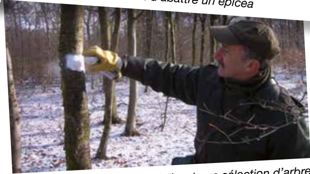
Agent technique du DNF réalisant une sélection d'arbres d'avenir