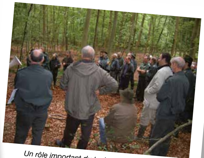
Un rôle important du technicien forestier, la sensibilisation du public