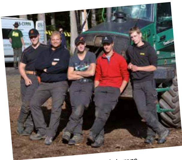
Elèves futurs bûcherons