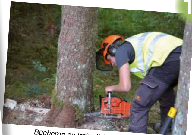
Bûcheron en train d'abattre un épicéa