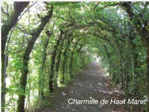
Charmille de Haut Maret

le charme est surtout apprécié pour la formation de haies, de tonnelles et de charmilles. Signalons à ce propos la charmille en tunnel du « Haut Maret » proche du village de La Reid (commune de Theux). Le tunnel de verdure est un des plus longs d'Europe : il mesure 473 m de long et est constitué de 4700 plantes ! La dénomination néerlandaise « haagbeuk » indique bien l'aptitude du charme à constituer des rideaux de verdure.