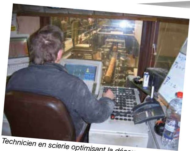
Technicien en scierie optimisant la découpe des bois

Les ouvriers en sylviculture sont formés en trois années à l'issue desquelles ils sont, notamment, bûcherons, entrepreneurs sylvicoles, exploitants forestiers. Les bons bûcherons sont précieux : ils doivent pouvoir travailler en situations difficiles (le long de voies ferrées, de voirie, en zones de parcs fréquentés, doivent pouvoir exploiter en forêt et faire tomber les arbres en-dehors d'une réserve naturelle, d'un ensemble de jeunes semis, sans abîmer un arbre de grande valeur, etc). Le bûcheron doit aussi pouvoir cuber un arbre abattu et décider de sa destination, en tout ou en partie (bois de qualité, bois de chauffage, etc). L'ouvrier forestier, suite à une spécialisation en conduite d'engins forestiers, peut prendre les commandes des machines telles que les porteurs forestiers, les débardeuses, les abatteuses qui sont des monstres en taille mais aussi de technologie.